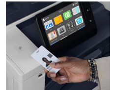
Kartenleserschacht , mit integriertem USB-Anschluss. 3

Standardbehälter 1 für 520 Blatt 2 , für Materialformate von 139,7 x 182 bis 297 x 431,8 mm / 5,5 x 7,17 bis 11,69 x 17 Zoll.