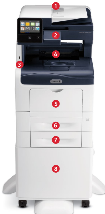
Xerox® VersaLink® C405 Farb-Multifunktionsdrucker Drucken. Kopieren. Scannen. Faxen. E-Mail.