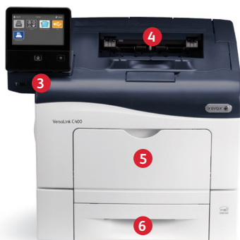
Xerox® VersaLink® C400 Farbdrucker Drucken.