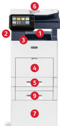
Xerox® VersaLink® B605 Multifunktionsdrucker Drucken. Kopieren. Scannen. Faxen. E-Mail.