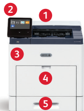
Xerox® VersaLink® B600 Drucker Drucken.